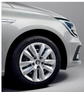
Jante de oțel 16" Flexwheel, design Elliptic