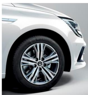
Jante aliaj 16", design diamantat Impulse

Disponibil standard pentru motorizarea Blue dCi 115 EDC