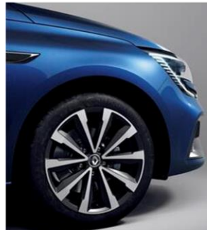
Jante aliaj 17" design diamantat Monthéry